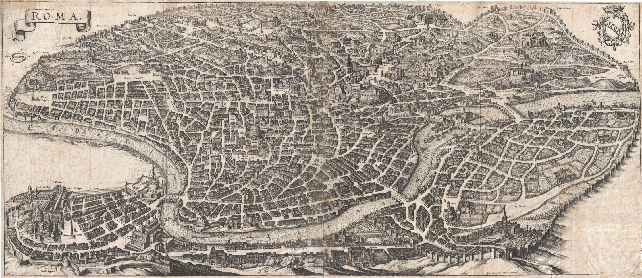
1652 - Merian Panoramic View or Map of Rome

Roberto Gualtieri e Francesco Rutelli presentano il libro: